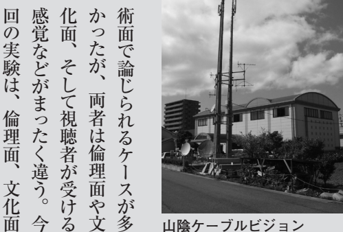
山陰ケーブルビジョン

ただし、今回の実験は事業化に直結せず、事業化は「次の次を狙う」(石原氏) スタンスのようだ。 今回の実験と並行して、ヤフージャパンは、インターネットテレビ向けのコンテツ配信を4月に開始した。ケーブル業界においても、テレビメーカーのテレビポータル、アクトビラ、そしてNHKオンデマンドなどの動向を見極め、今後のメディア競争に勝ち抜くための戦略を練り上げる必要があると見られる。